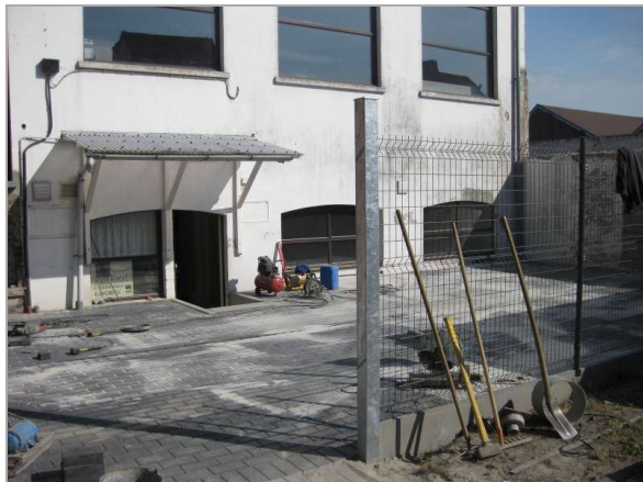
Nieuwe klinkers, benedentrap en hekken