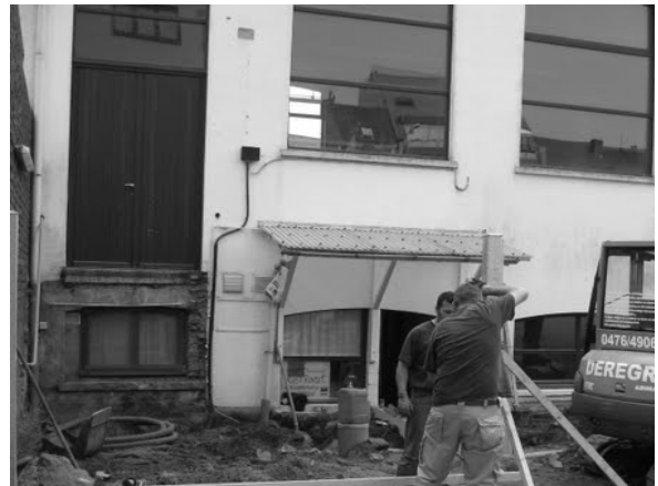
weg met die oude trap!